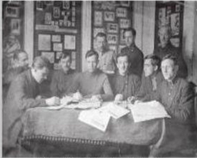
Перед реализацией печатной газеты «Дзювец» с авторами.

Первый день рождения - 14 декабря 1929 года. С этого дня газета «Дзювец» стала районной.