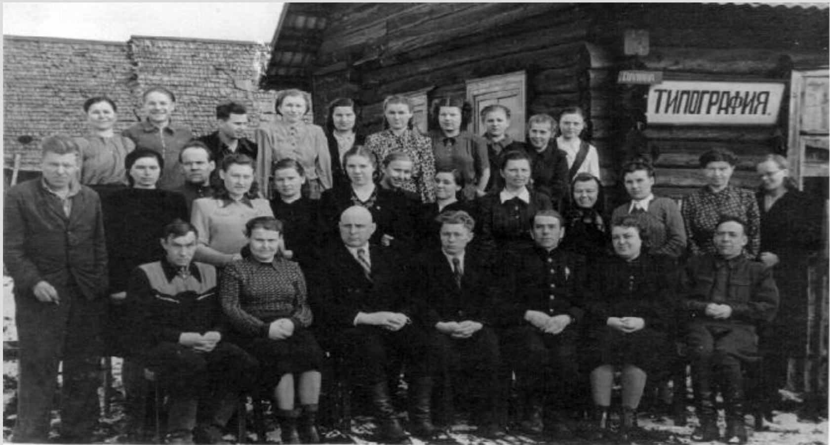
Коллективы редакции газеты «Дновец» и типографии. ул. Сталина, д.54. 14 апреля 1954 года.