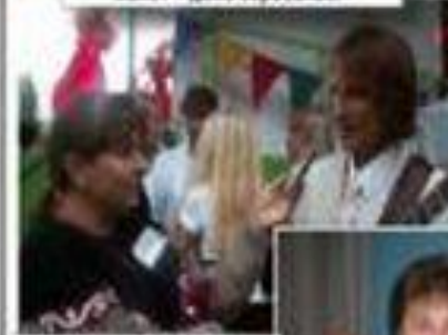
Любовь Лазутина: «Главное - чтобы не сели батарейки в диктофон!»